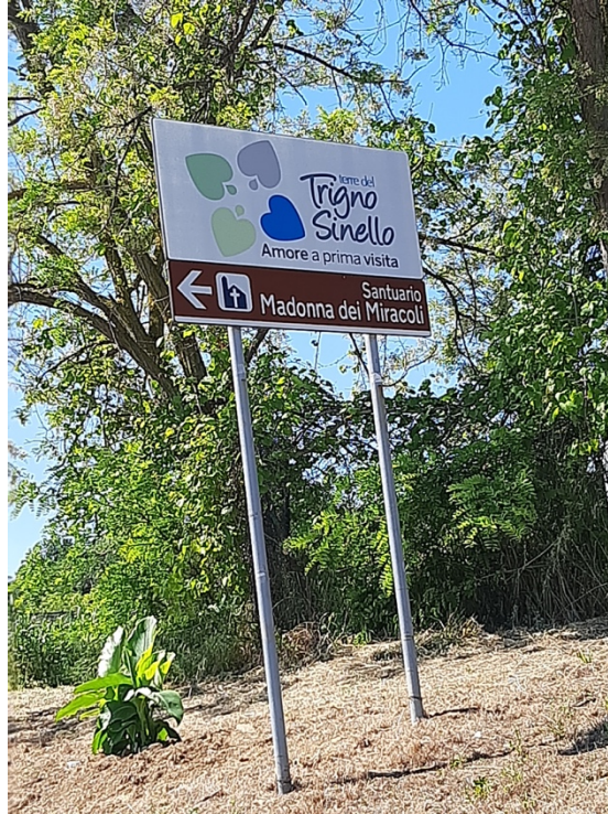
Fig. 2 – Indicazioni per Il Santuario della Madonna dei Miracoli a Casalbordino