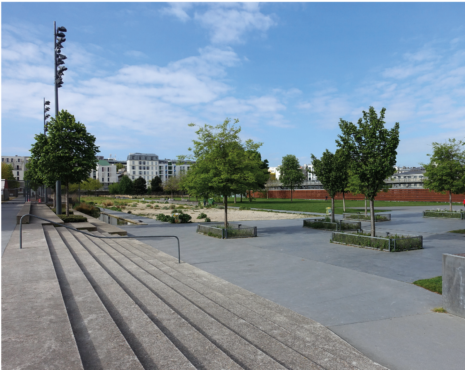
01. Le Parc de la Cour du Maroc - Jardins d'Eole a Parigi.