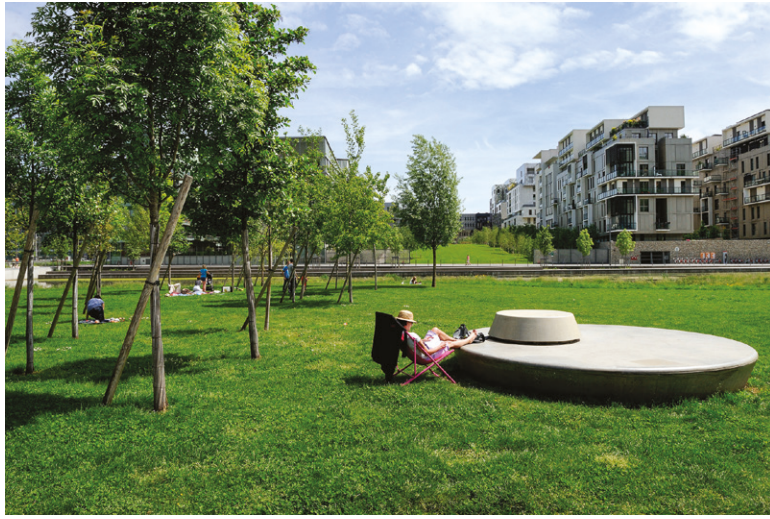
02. Jardins aquatiques Jean Couty, La Confluence, Lyon. Jardins aquatiques Jean Couty, La Confluence, Lyon. Laurence Danière

basati sulla temporaneità, sulla pluralità degli usi e sull'importanza dell'identità dei luoghi.