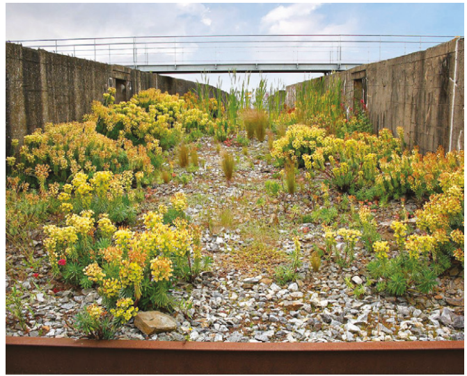
05. Jardins du Tiers-Paysage, Saint-Nazaire, Francia – progetto di Gilles Clément e Coloco. Jardins du Tiers-Paysage, Saint-Nazaire, France – designed by Gilles Clément and Coloco. Gilles Clément

strumento progettuale guida nelle azioni di recupero e riqualificazione, in grado di assimilare la dimensione del tempo e dell'evoluzione dei luoghi e delle esigenze (Mouffe, 2008; Manigrasso, 2020). Il progetto di paesaggio assume una valenza inedita, in alcuni casi come “strumento terapeutico” capace di sanare l'impatto e i danni legati a massivi processi di urbanizzazione e modernizzazione della società industriale (Jakob, 2009). La condivisione di questo pensiero non è un'implicita accettazione della “verdolatria”, così come introdotta e criticata agli inizi del XXI secolo dal filosofo Alain Roger. La scelta del paesaggio e del tempo come nuovi materiali di progetto è in grado infatti di sintetizzare soluzioni innovative e performanti, lì dove sia capace di superare il mero valore estetico, comprendendo la natura profondamente culturale del paesaggio stesso. Le buone pratiche descritte si fondano sull'interrelazione tra l'uomo e l'ambiente, suggerendo l'importanza di interpretare la “voce” dei luoghi e riconoscere il ruolo conformatore del tempo sul progetto.