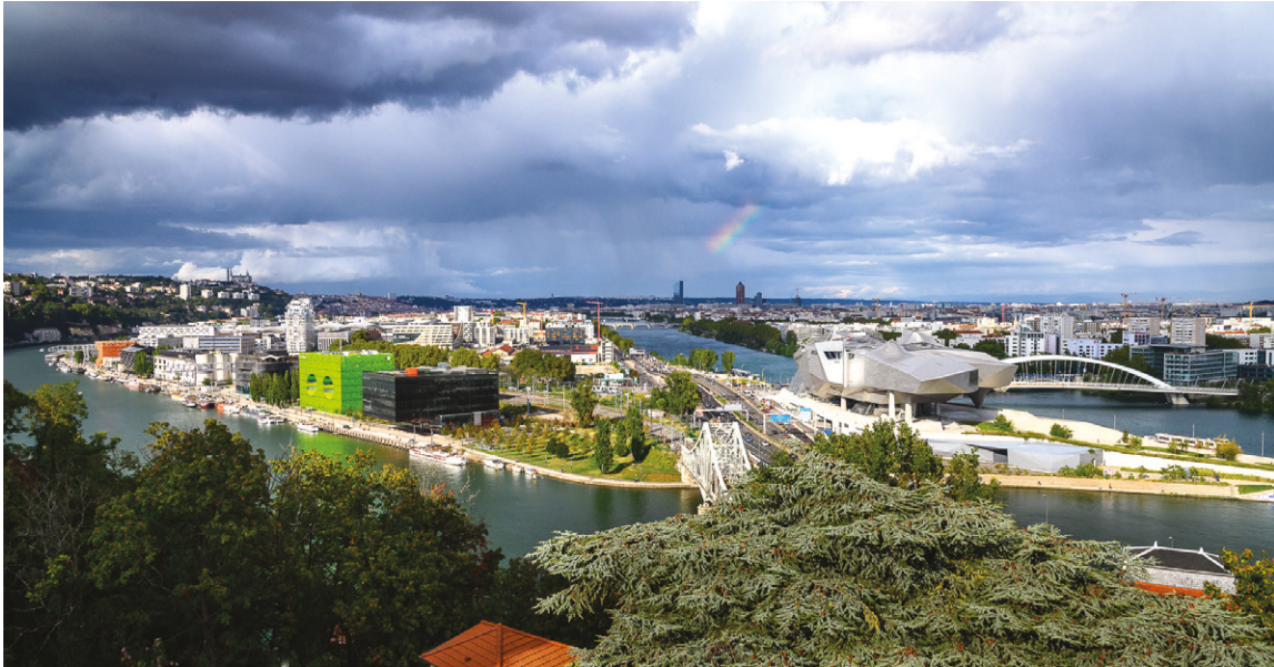
04. Quai Rambaud vista da La Mulatière, La Confluence, Lione. Quai Rambaud view from La Mulatière, La Confluence, Lyon. Laurence Danière

comfort ambientale specialmente nei tessuti maggiormente urbanizzati. Ciò significa che se è vero che gli spazi vuoti devono essere opportunamente integrati nella struttura della città e riconvertiti a nuovi scenari d'uso, è necessario valutare che “non tutti i vuoti devono essere colmati” (Nenko e Petrova, 2018, p. 389) e che un sistema poroso può