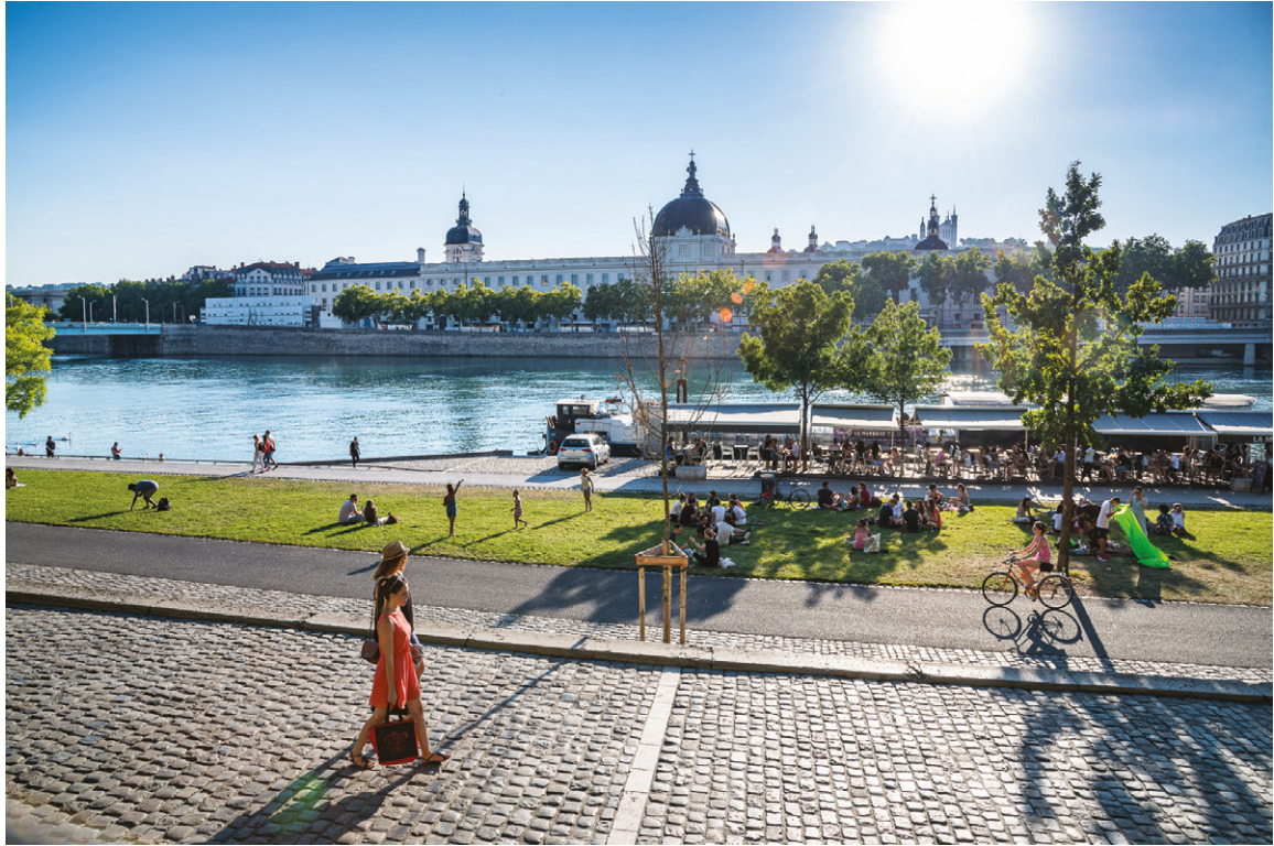
03. Spazi pubblici pedonali sulle rive del Rodano, La Confluence, Lione. Public spaces on Rhone's banks, La Confluence, Lyon. Laurence Danière

bile anche dal piano delle Costanti ideato da Desvigne, pensate per garantire linee di coerenza strutturale a un processo trentennale flessibile e adattabile alle esigenze mutevoli. “La mutabilità offre la facoltà di prevedere l'imprevedibile” (Durand, 2012, p. 86) e alimenta la dinamicità dei complessi progetti urbani, di cui il paesaggio può essere considerato parte integrante.