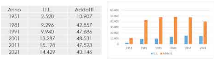
Fig. 3. Pescara: evoluzione del profilo economico-produttivo.

Parallelamente, la strada della rigenerazione urbana intrapresa dalla città di Pescara nell'ambito della cornice istituzionale entro cui operano i fondi strutturali e di investimento europei e il più recente PNRR, sembra essere andata oltre la mera riqualificazione di aree periferiche degradate (a partire dai primi progetti Urban) e di spazi pubblici identitari da rifunzionizzare (su tutti, waterfront fluviale e lungomare) per aderire ad una nuova cultura della trasformazione urbana post-moderna improntata sull'idea di città sostenibile, condivisa e partecipata. Il riferimento è ad alcuni progetti, tra cui quello SUS (Strategia per lo Sviluppo Urbano Sostenibile) 39 basato principalmente sul potenziamento della mobilità sostenibile attraverso la realizzazione di un sistema di trasporto pubblico ecologico ed intelligente e il rafforzamento della mobilità ciclabile e pedonale 40 che ha saputo incidere sulla quotidianità dei cittadini con una proposta di mobilità alternativa e integrata, innalzando la qualità della vita e contribuendo a diffondere la cultura della sostenibilità 41 (fig. 4). O, ancora, il progetto Periferie 42 che ha inteso la rigenerazione in termini sociali e culturali con l'intento di centralizzare aree marginali, facendone spazi laboratoriali partecipati (Social Art, Spazio Matta, La casa delle arti).