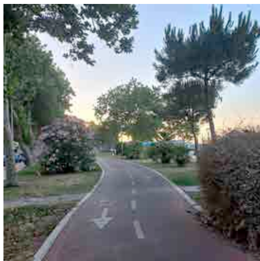
Fig. 4. Pescara: pista ciclabile riviera sud.

Rivoluzione verde e transizione ecologica continuano a qualificare anche molti obiettivi PNRR 43 , confermando una città tesa a migliorare la propria immagine (e il primato conquistato da Pescara tra le 69 Core City europee con la sottoscrizione dei primi 4 Local Green Deals va certamente in tale direzione) 44 e la qualità di vita dei propri abitanti, mentre più incerta appare la sua visione strategica in termini di competitività economica, svelando margini di vulnerabilità rispetto ad alcuni settori, quale quello turistico che sconta una relativa debolezza in termini di ricettività (appena 18 strutture alberghiere, al 2022) 45 e di scarsa organizzazione e promozione e che tanto potrebbe contribuire all'economia di una città, per sua natura potenzial-