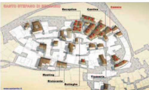
Fig. 2: L'Albergo Diffuso di Santo Stefano di Sessanio in Abruzzo