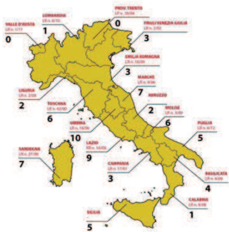
Fig. 1: L'Albergo Diffuso in Italia (in nero il numero di AD per Regione in rosso le Leggi Regionali)