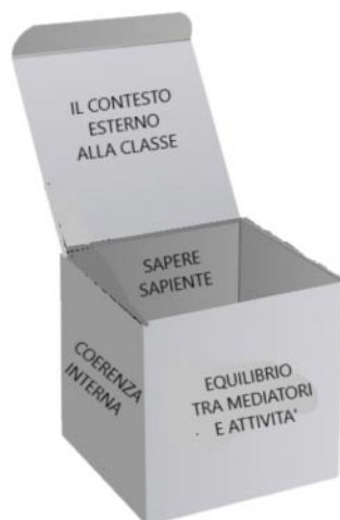
Fig. 1. – Il cubo (box) utilizzato come artefatto per la progettazione.

box ), metafora del processo che lo studente deve attivare nel momento in cui procede alla progettazione della sessione di lavoro (si veda fig. 1): entrare nella situazione, immergendosi quindi nella previsione dell'azione o meglio nell'azione simulata e anticipata; uscire dalla situazione, distanziandosi da quanto ha ideato, connettendolo fortemente al contesto, per analizzarlo e riconsiderarlo in maniera critica [13].