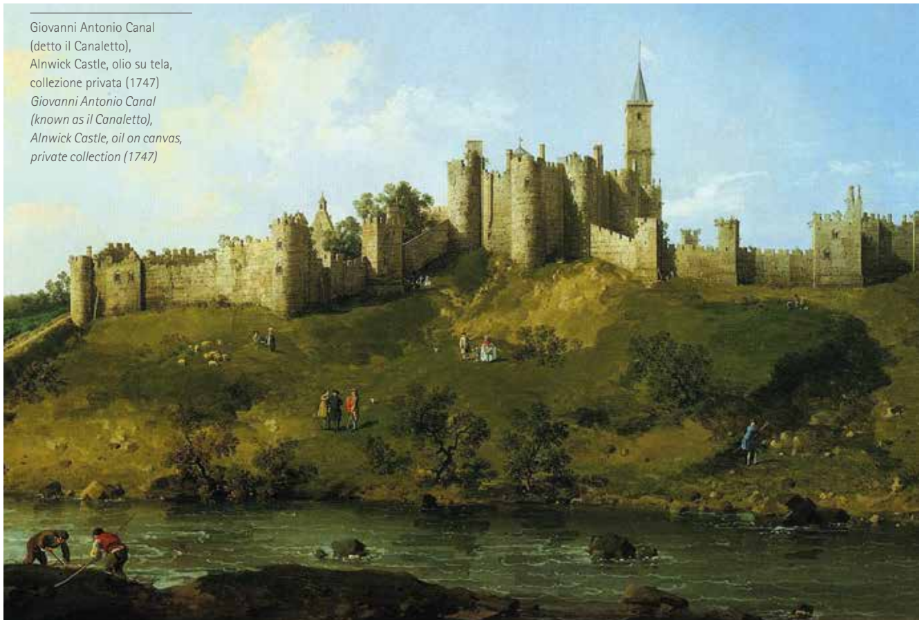
Giovanni Antonio Canal (detto il Canaletto), Alnwick Castle, olio su tela, collezione privata (1747) Giovanni Antonio Canal (known as il Canaletto), Alnwick Castle, oil on canvas, private collection (1747)

con l' Adventus Saxonum il popolamento si spostò nei centri urbani di cui è erede l'attuale struttura insediativa, appartenente al ciclo territoriale di consolidamento. Il fenomeno equivalente all'incastellamento avvenne dopo l'invasione normanna (X-XI sec.), diretta all'affermazione di una signoria territoriale piuttosto che alla costruzione di un sistema difensivo, come in Italia 8 : qui i normanni invasori