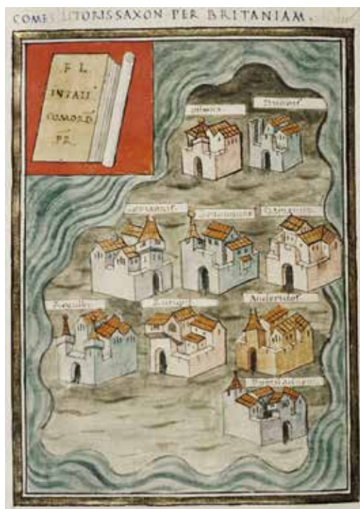
Comes litoris Saxon per Britanniam, Cosmographia Scoti, Notitia dignitatum , etc., ms. canon. misc. 378, fol. 153v, Bodleian Library, University of Oxford, UK, 1436 (a sinistra) Comes litoris Saxon per Britanniam, Cosmographia Scoti, Notitia dignitatum , etc., ms. canon. misc. 378, fol. 153v, Bodleian Library, University of Oxford, UK, 1436 (on the left)