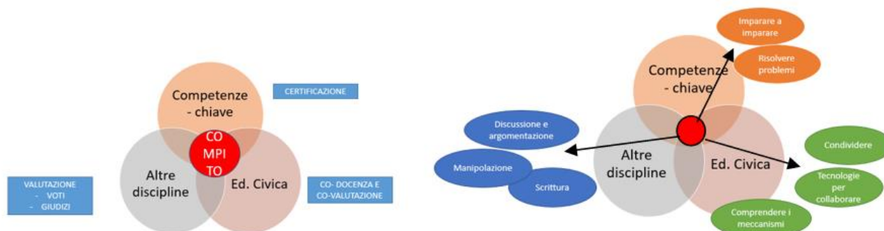
Figura 3: la prospettiva integrata e un esempio di sistematizzazione dei processi emersi da un compito

Magnoler, 2015) per capire e dichiarare tramite apposite rubriche quali processi formativi, intrinseci alle competenze di Cittadinanza, avessero contribuito ad avviare, implementare e consolidare, secondo lo schema proposto nella Figura 3.