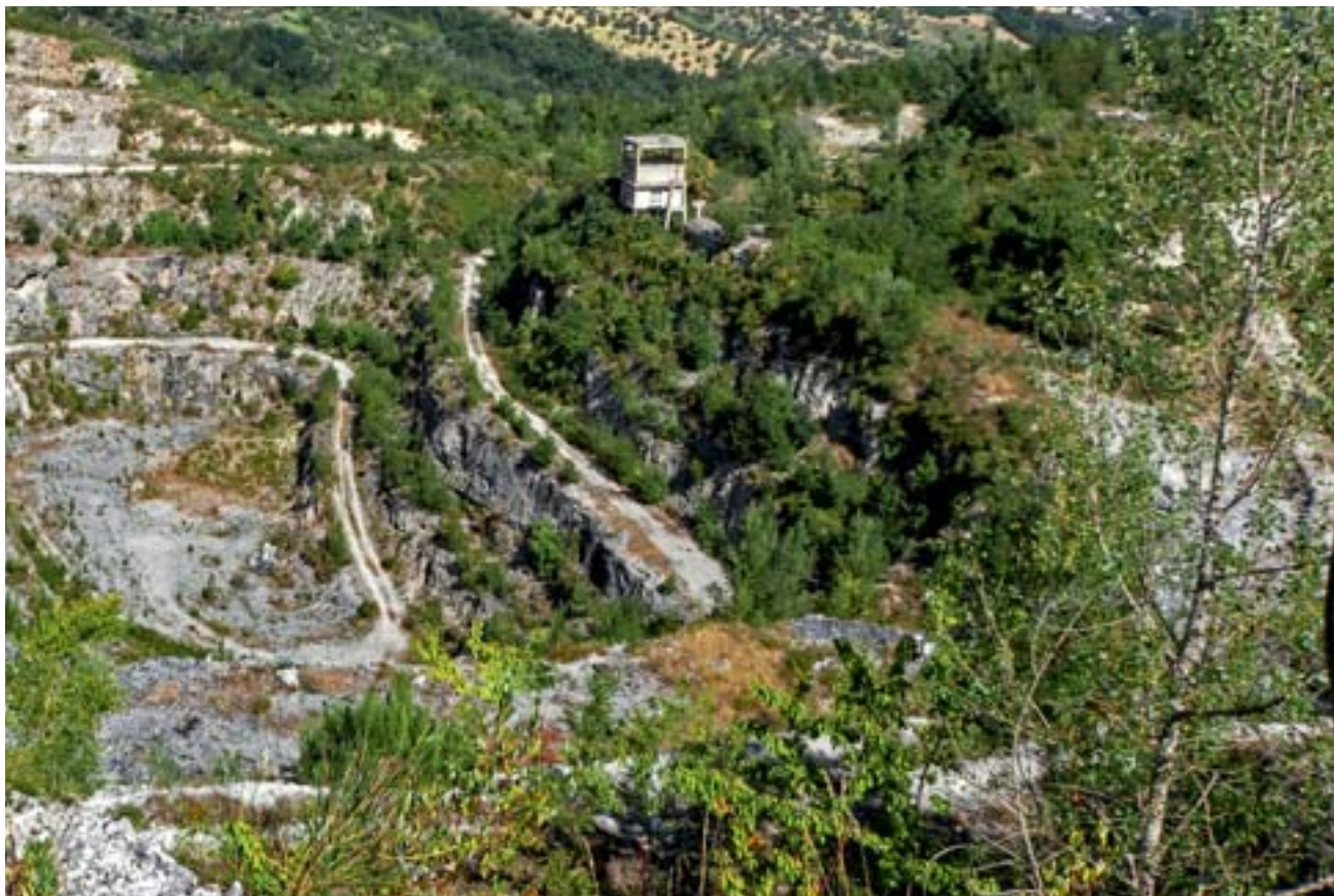
15-16/ Bacino minerario della Majella (Manoppello). Area di estrazione di Foce Valle Romana.

di trasformazioni tuttora riconoscibili e ha sostenuto nel lungo periodo l'unitarietà dell'area, di fatto snodo tra i territori in quota e le terre basse di valle e di costa. Ad oggi è un territorio irrisolto, in bilico tra un passato concluso e un futuro incerto.