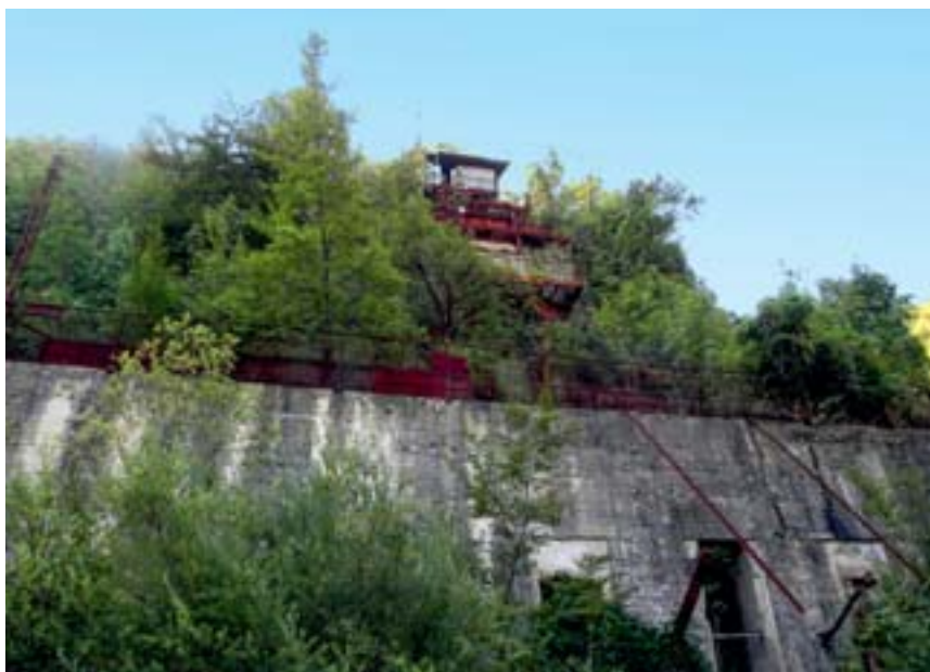
13-14/ Bacino minerario della Majella (Manoppello). Area di estrazione di Foce Valle Romana.

si accostano e si sovrappongono nel tempo e nello spazio e costituiscono un insieme singolare dell'ambiente appenninico: gli insediamenti preistorici nella valle Giumentina, i luoghi dell'eremitaggio celestiniano, la rete delle capanne a tholos, gli insediamenti medievali, i materiali della natura in parte trasformati dalla pastorizia, dall'agricoltura di sostentamento e dall'economia del bosco. Il ciclo economico concluso ha costituito lo sfondo