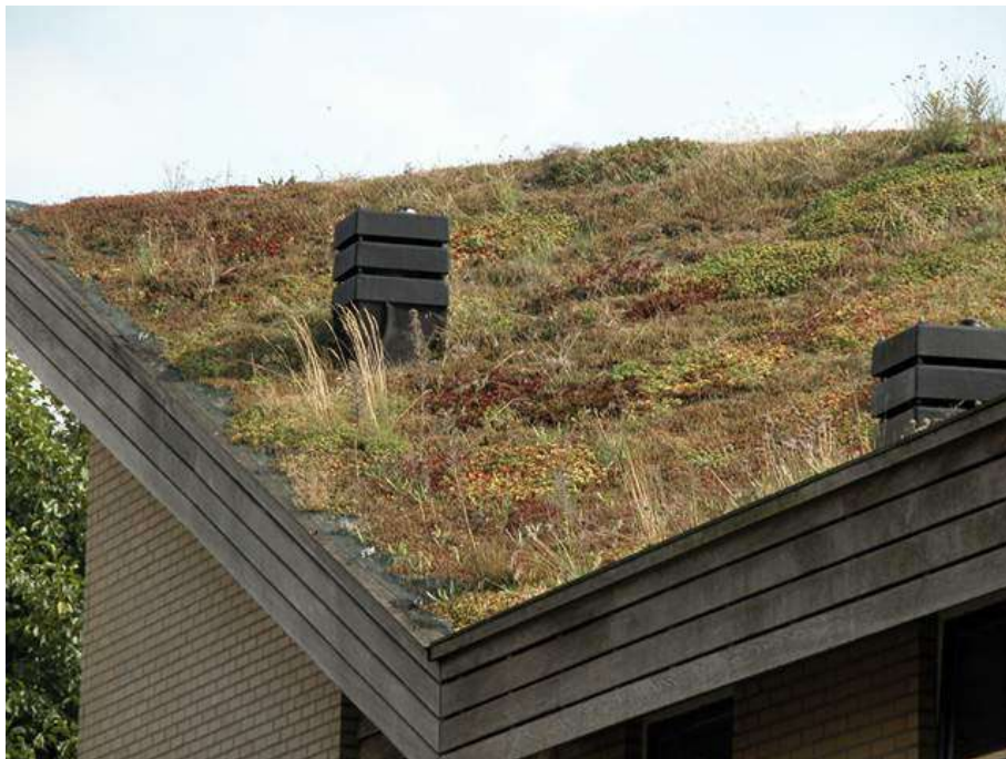
Ecolonia, Alphen-sur-le-Rhin (Paesi Bassi) 1989

zione della viabilità finalizzata alla coesistenza pacifica tra pedoni, biciclette e (poche) auto. Esternamente, la zona in cui sorge la comunità è ben collegata con tutti i servizi necessari, raggiungibili anche con una passeggiata. Il quartiere è stato costruito seguendo uno schema di sviluppo a carattere spontaneo, per ospitare persone di culture e abitudini diverse. Avere tanti progettisti implica infatti avere tanti tipi di strutture abitative, una varietà utile per venire incontro a necessità differenti. Il risparmio energetico delle residenze di Ecolonia è del 30% rispetto a un'abitazione tradizionale, 40% è la diminuzione del consumo di carburante per i trasporti, 20% la diminuzione del consumo dell'acqua e nel 10% è stimata la riduzione dei consumi elettrici.