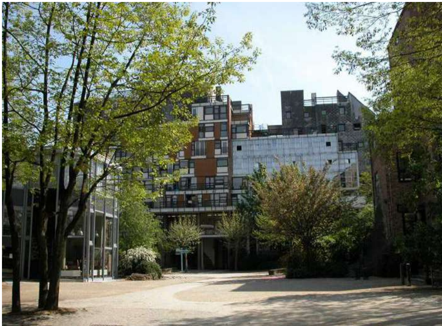
Faculté médecine: UCL, Bruxelles (Belgio) 1970

Perfettamente in linea con quanto esplicitato da Zygmunt Bauman nei suoi saggi sulla società liquida dove l’incertezza che attanaglia la società moderna deriva dalla trasformazione dei suoi protagonisti da produttori a consumatori. L’esclusione sociale non si basa più sull’estraneità al sistema produttivo o sul non poter comprare l’essenziale, ma sul non poter comprare per sentirsi parte della modernità. Il povero, nella vita liquida, cerca di standardizzarsi agli schemi comuni, ma si sente frustrato se non riesce a sentirsi come gli altri, cioè non sentirsi accettato nel ruolo di consumatore. Tutto si trasforma in merce, incluso l’essere umano e i suoi rapporti sociali (Bauman, 2016) 3 .