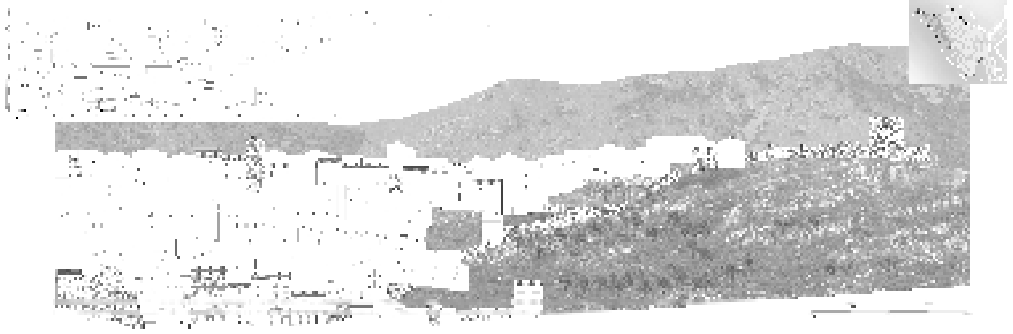
Fig. 6. Magliano dè Marsi (Aq). Rilievo di M. Bruni.

data la storia di lunga durata delle due regioni subisca l'inversione di marcia e l'accelerazione temporale che nel giro di cinquant'anni ne ha modificato la consistenza demografica fino al punto da collocarle ai primi posti tra le regioni italiane a maggior rischio di spopolamento e abbandono. Paradossalmente però, come già accennato, è proprio l'abbandono ad aver garantito il mantenimento dei vari centri in uno stato di conservazione segnato prevalentemente dal tempo e dalla circostanza di appartenere a territori fragili da un punto di vista sismico. E' un' "architettura senza architetti", per usare le parole di Rudofski, quella tessuta dalla rete dei borghi fortificati dell'Abruzzo e del Molise. A dispetto delle trasformazioni circostanti, è però ancora tenacemente resiliente, e capace di lasciare sullo sfondo la storia ampia e complessiva che le ha dato senso e ragione, per farsi individuale e insostituibile: elemento e prodotto di un contesto dove protagonista sono diventati il paesaggio, il legame col territorio e le sue risorse naturali. Tutto quanto serve per programmare un nuovo governo del territorio e avviare azioni di tutela all'altezza dei valori in gioco.