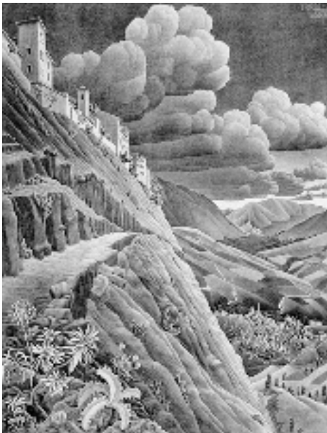
Fig. 4. Castrovalva (Aq). Veduta di M. C. Escher, 1929.

Lungo le vallate che si aprono sui tanti fiumi che dalle montagne scendono al mare - restituendo, col loro andamento perpendicolare alla costa, la morfologia a pettine delle due regioni - molto ricorrente è la tipologia a nastro, anche detta a schiena d'asino o a fuso poichè ordinata su una linea di crinale, occupata dalla strada principale, su cui si affacciano le abitazioni che scendono a valle, spesso in condizioni morfologiche estremamente difficili. Il caso più clamoroso è l'arroccatissima Castrovalva, nata a dominio e difesa della valle Peligna, e ridisegnata dall'olandese Maurits Cornelis Escher nel 1929, esaltandone la singolare osmosi di natura e artificio (Fig. 4).