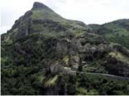
Fig. 1. Corvara (Pe).

Riguardo alla questione delle origini gli studi più recenti sembrano concordi nel riferire il fenomeno dell'incastellamento ad una vicenda di lunga durata, iniziata in alcune aree già in epoca post-imperiale e protratta almeno fino al XIII.