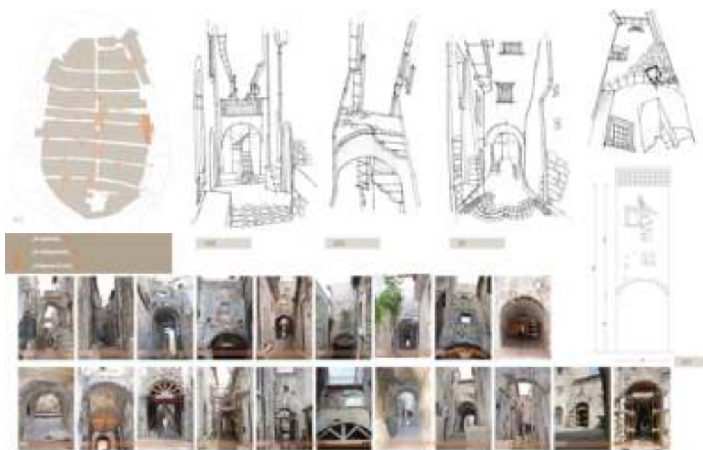
Fig. 3. Castelvecchio Calvisio (Aq). Rilievi e foto di E. Dante.

modelli costanti, è applicabile a pieno merito anche ai borghi fortificati cui i suoi castelli fanno riferimento, ma sulle cui forme non si sofferma.