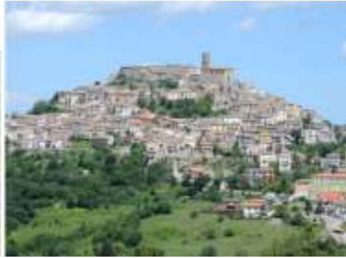
Fig. 2. Carunchio (Ch).

Come ha dimostrato Wickhman per l'area valvense, la concentrazione demica entro un sito di più o meno modeste dimensioni, è opera della volontà degli abitanti, contadini per la maggior parte, spinti a raccogliersi nei nuovi centri abitati per il vantaggio attribuito alla migliore gestione delle campagne circostanti, oltreché per la salubrità riconosciuta ai siti di altura rispetto alle plaghe di fondovalle infestate dalla malaria.